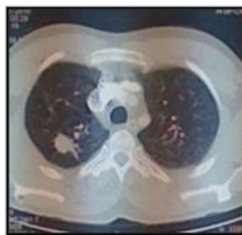
Fig 4 : TDM thoracique en fenêtre parenchymateuse Objectivant un nodule tissulaire spiculé du segment postérieur du lobe sup droit