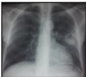
Figure 5 : radiographie thoracique de face montrant une opacité excavée se projetant sur le Nelson gauche.

Patient de 59 ans, tabagique chronique et diabétique sous métformine, admis pour syndrome fébrile trainant avec à l'imagerie thoracique un macronodule tissulaire excavé du Nelson gauche associé à de multiples nodules de lobe moyen et du lobe inférieur gauche. Le bilan phthisiologique est négatif et la bronchoscopie montre un aspect inflammatoire diffus de la muqueuse bronchique. Une biopsie transpariétale du macronodule a permis de retenir le diagnostic de tuberculose pulmonaire. (Figures 5 et 6)