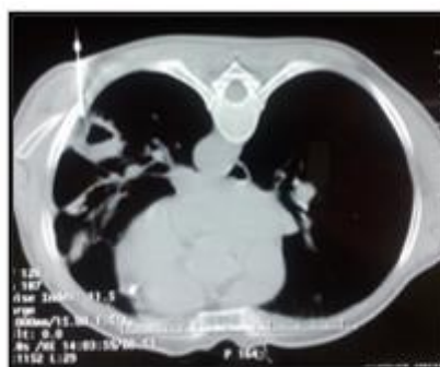
Figure 6 : TDM thoracique lors d'une biopsie scannoguidée transpariétale en decubitus ventral du macronodule du Nelson gauche