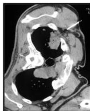
Fig 8 : TDM thoracique lors d'une biopsie scannoguidée transpariétale en decubitus latéral gauche de la masse apicale droite.