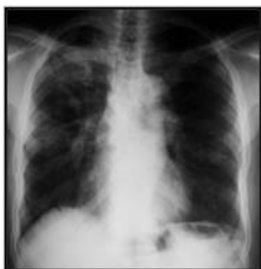
Figure 7 : radiographie thoracique de face objectivant les masses et nodules multiples des deux champs pulmonaires.

Le dernier patient est âgé de 68 ans, non tabagique, diabétique sous sulfamide, admis pour la prise en charge d'une masse tissulaire apicale droite avec nodules du lobe supérieur droit et de la lingula avec adénopathies hilaires droite, 3 recherches de BK dans les expectorations sont négatifs à l'examen direct, la bronchoscopie montre une tache anthracosique au niveau de l'orifice du lobe moyen, et la biopsie transpariétale scannoguidée confirme le diagnostic de tuberculose. (Figures 7 et 8)