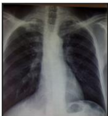
Figure 3 : radiographie thoracique de face montrant un nodule apical droit retro claviculaire

Le deuxième patient est âgé de 63 ans, ancien tabagique et suivi pour adénocarcinome prostatique, présentant un nodule apical droit tissulaire et spiculé sans adénopathies médiastinales, l'intradermoréaction à la tuberculine est à 13 mm, le reste du bilan phtysiologique est négatif et la bronchoscopie montre un aspect normal. Une résection atypique suite à une thoracotomie objective à l'examen anatomopathologique un granulome tuberculeux avec nécrose caséuse. (Figures 3 et 4)