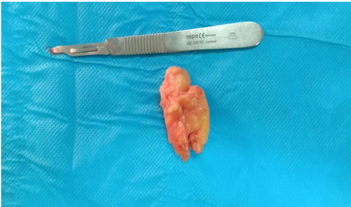
Fig 3 : vue peropératoire du lipome parotidien