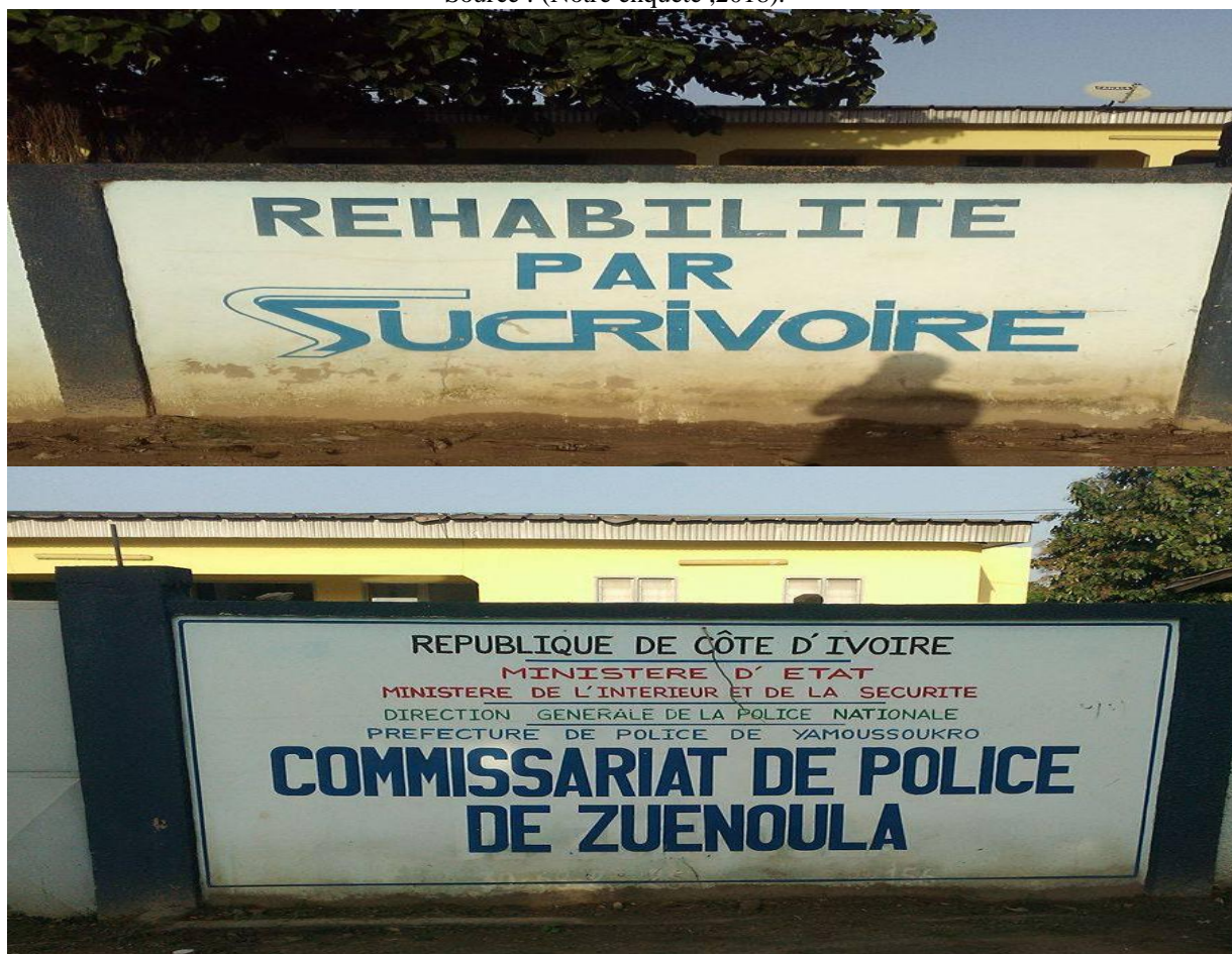
Figure 4 : Une vue du commissariat de police de Zuénoula réhabilité par Sucrivoire