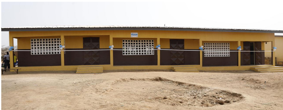
Figure 8 : Une vue de l'inauguration de trois salles de classe par SIFCA à Séhizra et Bouata.