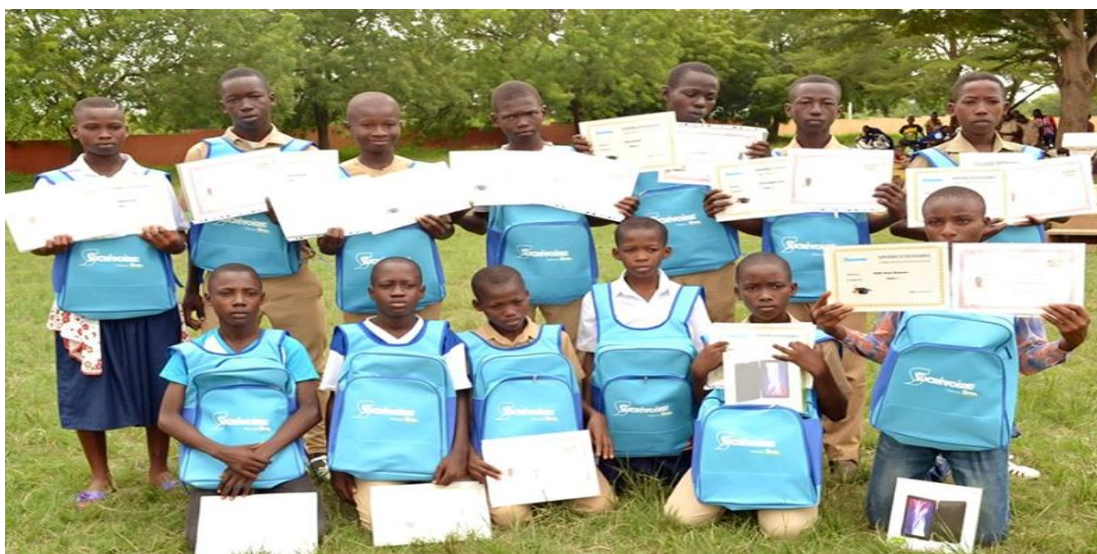
Figure 3 : Une vue de remise fournitures scolaires et de diplômes d'excellence aux meilleurs élèves du collège

Pour le projet Cannes Villageoises (2016-2020), les plantations de cannes villageoises/pluviales, le montant prévisionnel était estimé à 163 022 825 millions dollars/US Ledit montant, a été réparti entre huit coopératives villageoises (Cojea-Canvi, séhizra, ourouzra, klazra, douenfla, bouata-village, rolandfla, Marahoué) ; ces dernières étant situées dans la périphérie de l'usine ; c'est-à-dire à moins de vingt-cinq kilomètres (25 km). Pour les campagnes 2015-2016, 2016-2017, -2018-2019 et 2019-2020 avec l'appui financier de l'Union Européenne, elle a mis en valeur plus de 1000 ha de cannes villageoises toujours au profit des communautés locales (Voir la figure 6). En plus, Sucrivoire octroie chaque année plus de 100 000 mille dollars /US aux autorités (Conseil municipal, et représentation du Conseil Régional), et réhabilita des bâtiments administratifs (voir la figure 4) dans le département de Zuénoula.