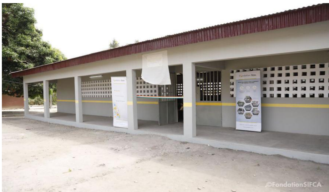
Figure 5 : une vue d'une cantine scolaire construite par le groupe SIFCA à Binzra, dans le département de Zuénoula. Source : (Notre enquête ,2021)