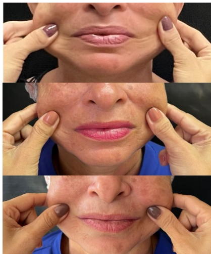
Figura 12 – Comparativo aspecto inicial, pós 3 meses e pós final 7 meses, respectivamente.