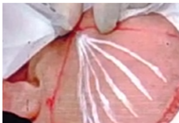
Figura 6 – Anestésico

Em seguida, foi aplicado um botão anestésico no ponto de convergência dos vetores utilizando 0,3 ml de Lidocaína com vasoconstritor a 2% (Figura 6). De forma a permitir a criação do pertuito, utilizou-se uma agulha de hipodérmica 18 G (Figura 7). Após a criação do pertuito, uma microcânula 22G/50mm foi utilizada para anestesiá-los vetores com lidocaína sem vasodilatador, para cada lado foi realizado 2ml de solução anestésica.