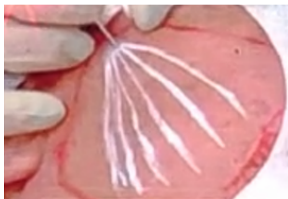
Figura 7 - Pertuito

Com o laser ainda desligado e após a anestesia de toda a área alvo, a fibra óptica foi introduzida até o limite distal do vetor desenhado na pele. Em seguida, o laser subdérmico foi ativado no pertuito em retro aplicação a fibra óptica de 400 mm nos vetores pré-determinados através das marcações, realizando de três a seis voltas com o laser ligado em dois comprimentos de ondas: 1470 nm e 980 nm, ambos na potência de 2W, totalizando 4W de potência, em modo contínuo até o alcance da quantidade de energia planejada de 1200J (Figura 8).